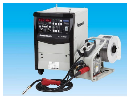
半自動パルス溶接機