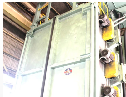
ショットブラスト機