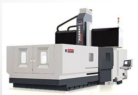
マシニングセンタ